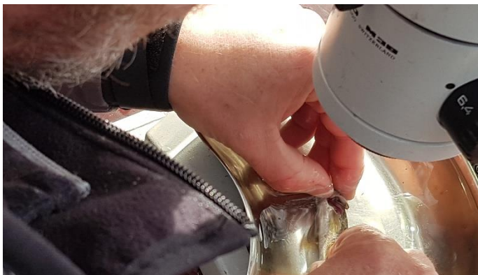
Bild 2. Förekomst av mussellarver undersöks på en öringens gälar fångad i Dainabäcken.

Vi genomförde även s.k. glochidieelfisken där antalet mussellarver på öringens gälar undersöktes innan åtgärd (bild 2).